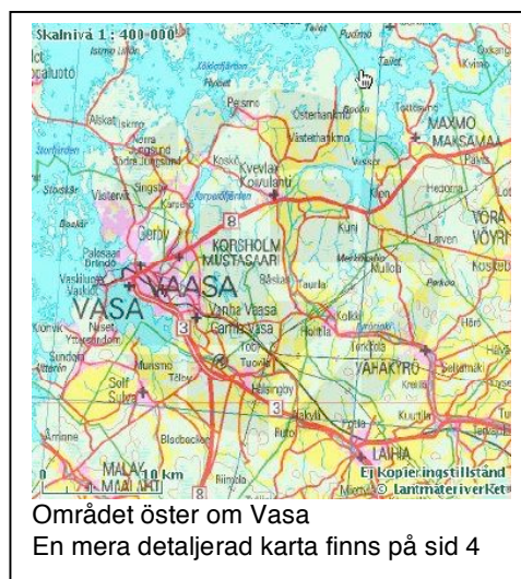
Området öster om Vasa En mera detaljerad karta finns på sid 4

I samband med att han kommer till Sverige byter han till styvfaderns namn. Kanske lät Sjöström mera svenskt än Snickars.